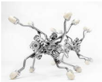
Bei der neuen Generation von UV-Lichtquellenkernen DN 500 bis 1200 erfolgt die Nennweitenanpassung des Kerns mittels elektrischen Antriebs und kann über eine Kamera im Packer beobachtet werden.

Aber was ist bei Planung und Ausschreibung zu beachten, welches Verfahren sollte überhaupt gewählt werden – und wie geht man mit dem notwendigen Fachwissen ausgestattet richtig an die Durchführung eines Projektes heran? Rechnet sich eine Neuverlegung oder sollte stattdessen in Sanierung investiert werden – das ist eine der ganz grundsätzlichen Fragen, die es zunächst zu klären gilt. Die Spannweite erprobter und bewährter Verfahren ist groß; die Standardlösung für jeden Fall, die man bei Bedarf einfach aus der Schublade ziehen kann, gibt es allerdings nicht. Genaues Hinsehen ist gefragt – in der Regel ist das gewünschte Sanierungsergebnis das Resultat vorausschauender Planung. Bei den gängigen Sanierungs- und Reparaturverfahren handelt es sich um etablierte Verfahren mit ausgereiften Produkten, das Schlauchlining hat ebenso längst seinen Platz gefunden wie manche Reparaturtechniken. Sanierung oder Reparatur? „Letztlich lassen sich beide Optionen nicht getrennt voneinander betrachten“, meint Dr. Borovsky. „Wer sich mit dem Thema Kanalinfrastruktur beschäftigt, muss sich mit der gesamten Bandbreite der möglichen Optionen beschäftigen und über dementsprechende Fachkenntnisse verfügen. Allein schon aus diesem Grund dürfte sich der Besuch der kombinierten Veranstaltung lohnen.“