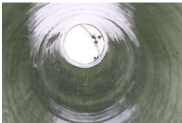
Ein dauerhaftes und zuverlässiges Sanierungsergebnis: Bei einer Schachtsanierung mit dem Vertiliner wird der Liner im Werk als Abbild des Schachtbauwerkes hergestellt.

Themenblock IV widmet sich ganz der speziellen Thematik der kleinen Durchmesser; zeitgleich findet das Firmenforum statt. Um „Materialentwicklung in kritischer Betrachtung“ geht es in Themenblock V. Hier wird es u.a. um Unterschiede zwischen im Werk und vor Ort gefertigten Produkten sowie um die Bedeutung gehen, die Materialkennwerte in diesem Zusammenhang gewinnen. Schließen wird auch die 14. Auflage des Schlauchlinertages mit der Gelegenheit zur Diskussion über die Frage „Quo vadis, Schlauchliner?“